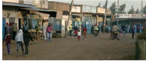
BILD: Eine Weitaufnahme (WA) zeigt uns eine sandige Straße. Menschen, der eine links im Vordergrund (=VG) sogar mit Kapuze, ist es kalt? – Nein, die entgegenkommenden Männer sind eher sommerlich gekleidet. Vor allem Männer gibt es auf der Straße. Die Werbetafeln an den Häusern sind einfach gemacht. Es herrscht reges Treiben. Durch den Sonneneinfall kann die Uhrzeit bestimmt werden: es ist früh am Morgen oder spät am Nachmittag. Die (Bild)-einstellung ist typisch für den Film, da öfter WA die Umgebung zeigt. Die Autoren des Filmes wollen zeigen, in welcher Umgebung die Hauptheldin, Jo, wohnt.

► (=allgemeine Bemerkungen) Typisch filmisch: Darunter wird verstanden, Erzählformen zu erkennen, die nur im Medium Film vorkommen können.