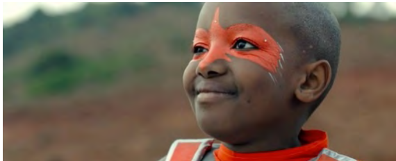
BILD: Im Schlussbild sieht man die rot geschminkte Jo. Die Kamera schwenkt von oben nach unten. Die Kamerabewegung geht bis zu den Schuhen, die sich – nach einer kurzen Pause - langsam von der Erde erheben, so als würde Jo zu fliegen beginnen.