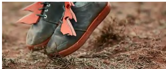
BILD: Füße stehen auf den Zehenspitzen. Die Schuhe haben rote Flügel. Die Erde ist sandig und mit Baumnadeln bedeckt. Auf alle Fälle spielt sich alles in der Natur ab. – Die Frage bleibt, ob der Mensch, der in den Schuhen steckt, noch lange so stehen bleiben kann.

Auch wenn Superhelden sterben, bleiben sie lange bei den normalen Menschen in Erinnerung. So eine Superheldin möchte Jo werden. Aber sie ist bereits eine, wenn man sieht, wie sie mit ihrem Leben umgeht. – Superpower. Superpower, Superpower! So sieht sie sich.