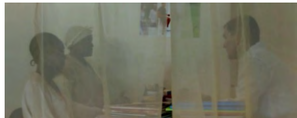
BILD: Die Körperhaltung der beiden Frauen links im Bild sagt uns, dass sie zuhören. Die rechte Person dürfte etwas erklären. Links von ihr liegen einige bunte Mappen, die dem übrigen Weiß des Zimmers, ähnlich auch das Plakat in der Mitte, eine fröhliche und entspannte Atmosphäre verleihen. Der Vorhang im Vordergrund (=VG) lässt uns aber wissen, dass wir bei diesem Gespräch nicht erwünscht sind.

Mutter und Schwester sitzen beim Arzt: Diese Aufnahme durch die Vorhänge sagt uns, dass etwas Wichtiges besprochen wird, aber von Jo und uns nicht gehört werden kann. Wir, die ZuschauerInnen sind auf der gleichen Höhe des Wissens wie Jo. – Der Arzt, Mutter und ihre Schwester wissen mehr. Erst später erfahren wir, worüber hier gesprochen wird: Jo ist krank. Mutter möchte sie mit nach Hause nehmen, da sie nur mehr wenige Monate zu leben hat.