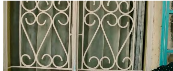
BILD: In leicht veränderter Perspektive sieht man das Fenster (wie zuvor) mit dem blauen Fensterrahmen und mit dem Gitter. Das Fenster ist verschlossen. Man hört weinen. Die optisch grafische Wiederholung lässt uns an Jo erinnern und an die Situation, als sie zuvor durch die spielenden Kinder ihr Schicksal, ihre nur noch kurze Lebenserwartung, erfährt.

Endlich wird der fertig gestellte Film am Dorfplatz gezeigt. Auch Jos Mutter sieht sich schließlich den Film ihrer Tochter „schweren Herzens“ an.