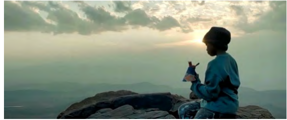
BILD: eine Einstellung, über die man sagt, dass sie schön ist: Alles ist stimmig. Die Farben, die Perspektive, das Licht und der HG strahlen Ausgeglichenheit und Ruhe aus. Jo sitzt mit ihrer Puppe über der Landschaft. Vielleicht ist es ihr Lieblingsplatz. Weit weg vom Alltag. – Kennt man die gesamte Erzählung, weiß man, dass diese Situation tatsächlich für Jo zu den schöneren gehört. – Dieses Gefühl zu vermitteln, bemühen sich die Filmautoren (Regie, Kamera).

Trotz ihrer Lebensfreude und offenem Zugang gegenüber Neuem kommt es auch immer wieder zu nachdenklichen Situationen, in denen sie gemeinsam mit ihrer Puppe, die sie immer und überall hinbegleitet, sinnierend in die Ferne blickt. Nicht, dass wir erfahren, was sie so nachdenklich macht. Aber da sie gegenüber ihren Freunden im Spital oder ihrer Schwester immer wieder ihren Wunsch äußert, dass die beste Superkraft ihrer Meinung nach das Fliegen wäre, kann man annehmen, dass sie auch in diesen ruhigen Momenten daran denkt. – In Tagträumen sieht sie sich auf einer Waldlichtung mit buntem, großem und wehendem Umhang auf der Suche nach Bösewichten.